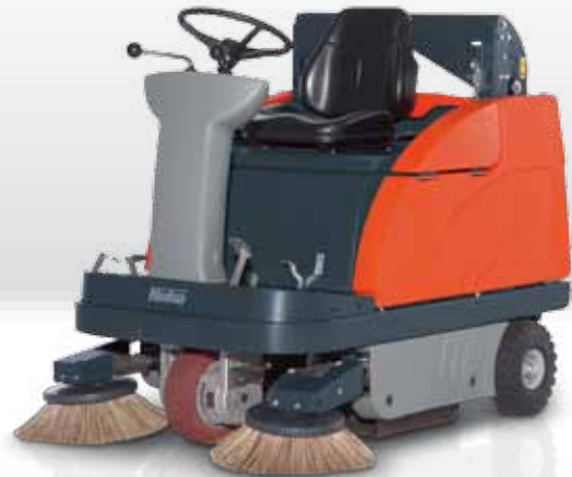
Hako-Jonas 980 EH